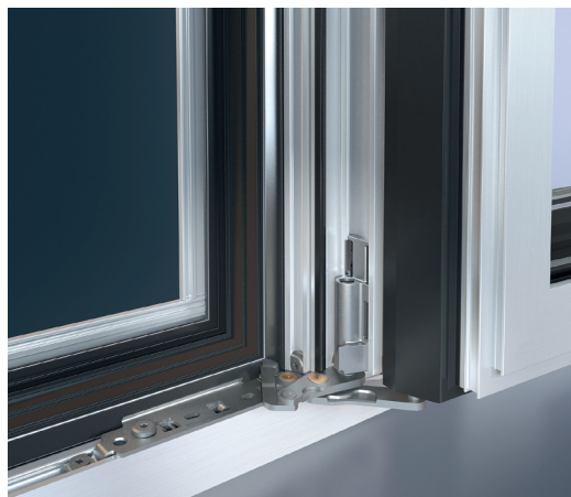
Lagăr de colț cu unghi de deschidere de 180° Corner pivot with 180° opening angle