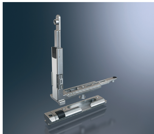
Colțar transmisie cu piesa de blocare și piesa de detensionare integrate Corner drive with integrated locking roller and with engagement block