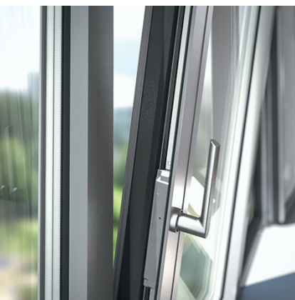
Tijă de acționare hibridă cu aspect de aluminiu Hybrid locking bar in tried-and-tested aluminium design