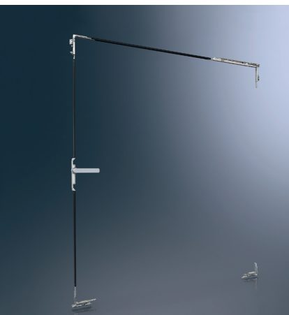
Configurația feroneriei pentru o fereastră oscilo-batantă Fittings configuration for turn/tilt windows