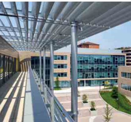
ALB – starr auskragend Passive ALB – cantilevered

Schüco Großlamellen ALB (Aluminium Active Blades) starr sind die Komplettlösung für umfassenden Sonnenschutz mit Großlamellen von 105 bis 690 mm – robust und langlebig. Die Lamellen können horizontal, vertikal sowie auskragend angeordnet werden. Mit einem breiten Sortiment an Lamellen und Halterungsmöglichkeiten bieten die starren Großlamellen überzeugende Vorteile: vom Schutz vor Überhitzung über optimierten Lichteinfall bis hin zu erhöhtem Komfort.