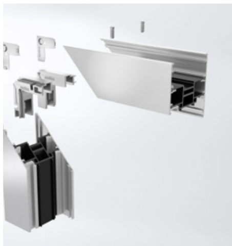
Elemente de îmbinare în colț cu prindere prin înșurubare - opțional. Screw-type corner cleats are an option