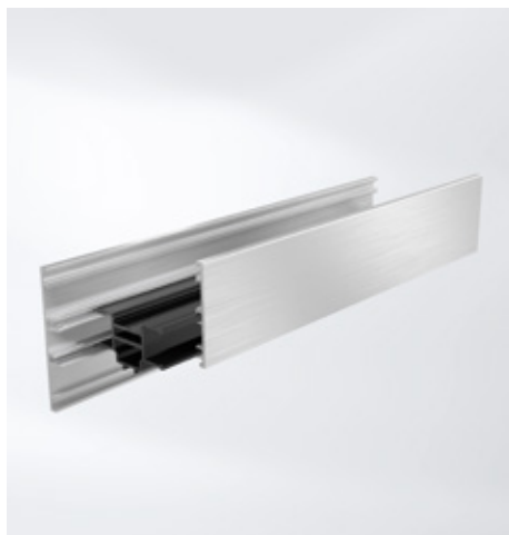
Izolator compozit pentru reducerea efectului de bimetale Split insulating bar to reduce the bi-metallic effect