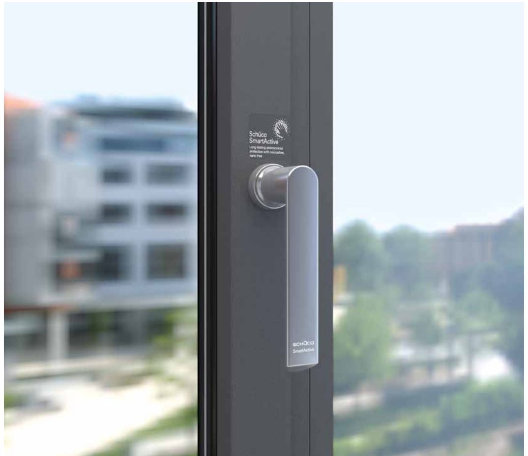
Schüco SmartActive: antimikrobieller Langzeitschutz für Fenstergriffe und Profile

Die Hygieneansprüche und -anforderungen speziell in Bereichen wie Krankenhäusern, Pflegeheimen, Kindergärten und öffentlichen Gebäuden wachsen stetig. Insbesondere mit Blick auf multiresistente Keime, die auf eine konventionelle Medikamentenbehandlung nicht mehr ansprechen.