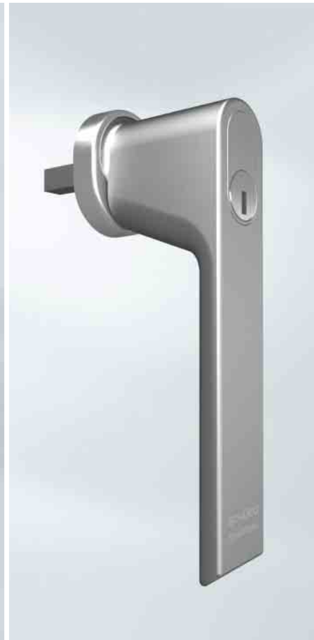
Schüco SmartActive: protecție antimicrobiană de durată pentru mânere de ferestre și profile.

Cerințele și normele de igienă din spitale, case de îngrijire medicală, grădinițe și clădiri publice sunt în creștere. Mai ales când este vorba despre germeni multirezistenți care nu mai răspund tratamentelor medicamentoase convenționale.